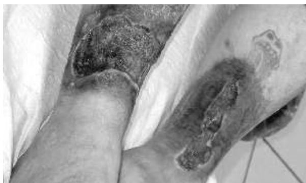
PatientInnen auf der Straße: Suchtkrank und ...

Seit kurzem beteiligt sich die Malteser Ambulanz an der Ausbildung von MedizinstudentInnen der Johann-Wolfgang-Goethe-Universität, die hier ihr allgemeinmedizinisches Blockpraktikum ableisten können.